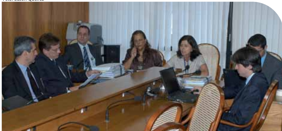
Três empresas participaram da licitação