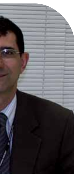
leio de Gestão de