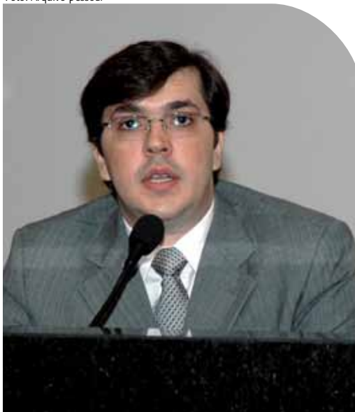
Frederico Dantas, juiz vice-diretor do Foro de Alagoas