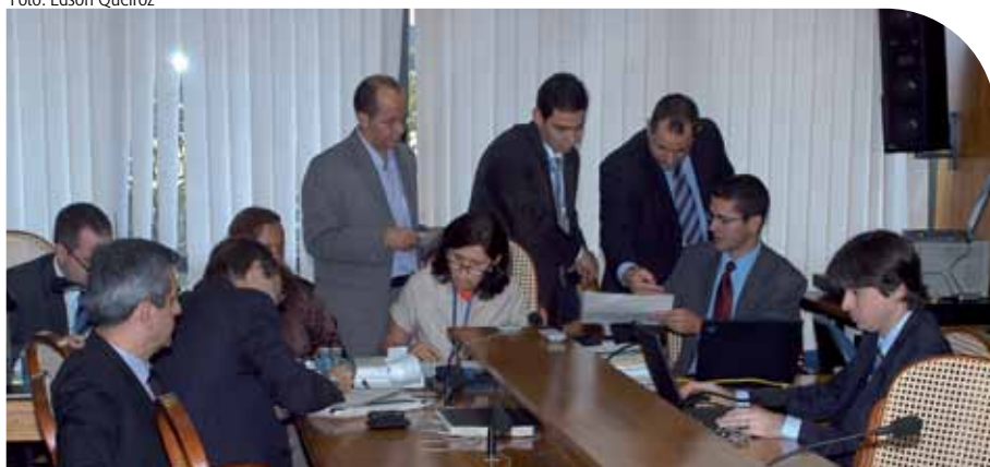
A licitação do SGP foi acompanhada pela equipe de TI do Conselho

dinamizando e integrando os processos essenciais de gerenciamento da força de trabalho: administração, folha de pagamento, gerenciamento de tempo e relatórios legais. Possibilita, também, a gestão de recursos humanos e sua alocação, conforme habilidades e disponibilidade.